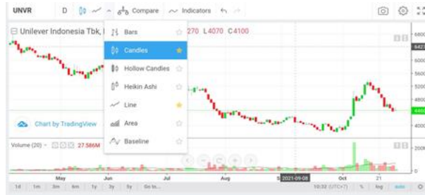
Gambar 1: Aplikasi RTI

Salah satu metode yang digunakan KSPM untuk memperkuat landasan teori yang di dapat, juga bisa dengan pengalaman, anggota akan di ajak mendaftarkan diri pada pihak sekuritas agar kemudian menjadi kan pengalaman mereka sebagai salah satu langkah menuju kesuksesan.