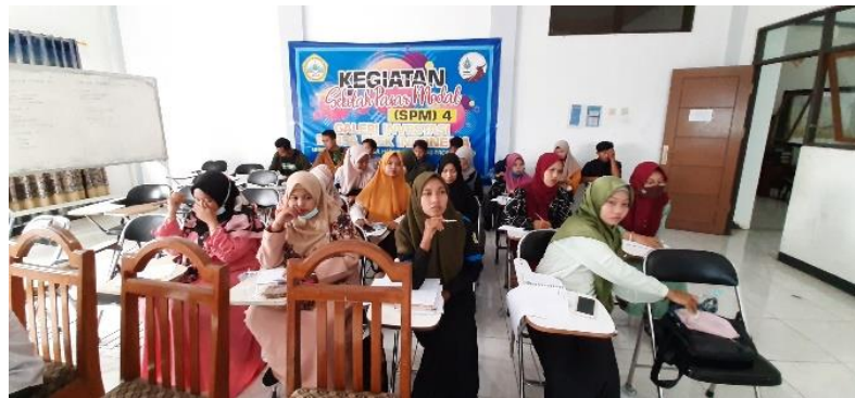
Gambar 5: Kegiatan Sekolah Pasar Modal dan Webinar dari BEI