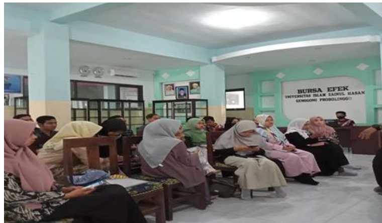
Gambar 2: Kegiatan Harian Anggota KSPM

Terlepas dari kajian rutin setiap 6 bulan sekali pihak KSPM mengadakan kegiatan seminar sekolah pasar modal dengan menghadirkan pemateri dari BEI (Bursa Efek Indonesia)